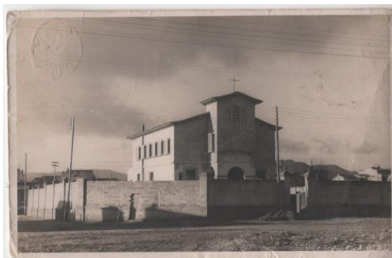
Primer Monestir als afores de la Vila d'Igualada, envoltat de camps, abans d'urbanitzar el Poble Sec.