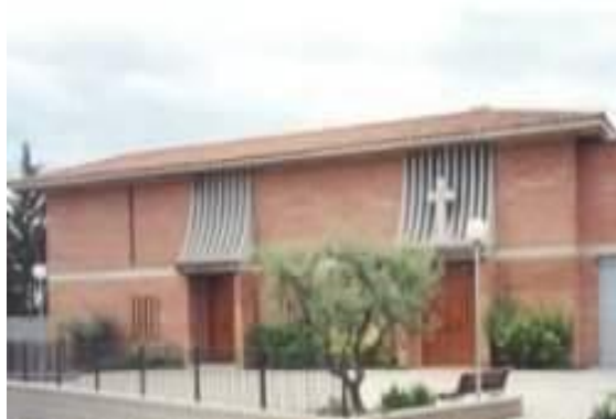
Actual Monestir ubicat als afores de la ciutat i al llinard dels termes de Jorba-Igualada.